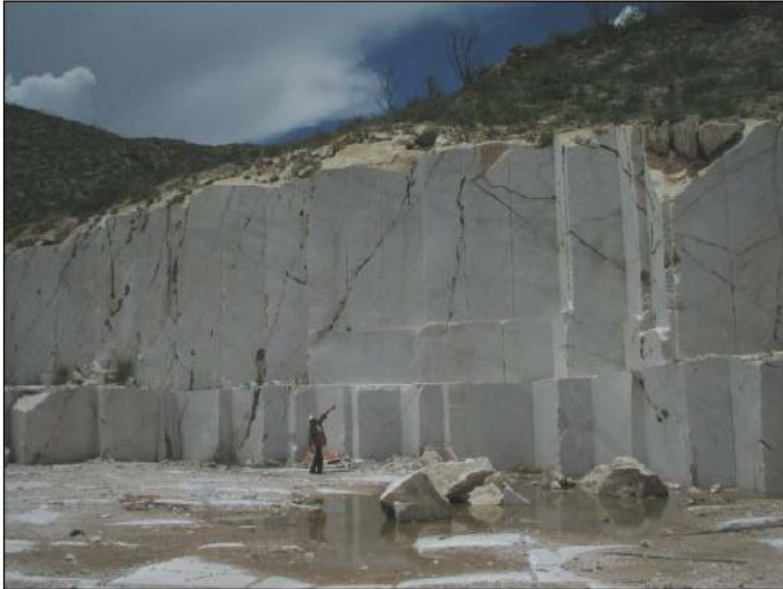
Banco de mármol de la localidad 30 de Noviembre, Mpio. Mapimí, Dgo.